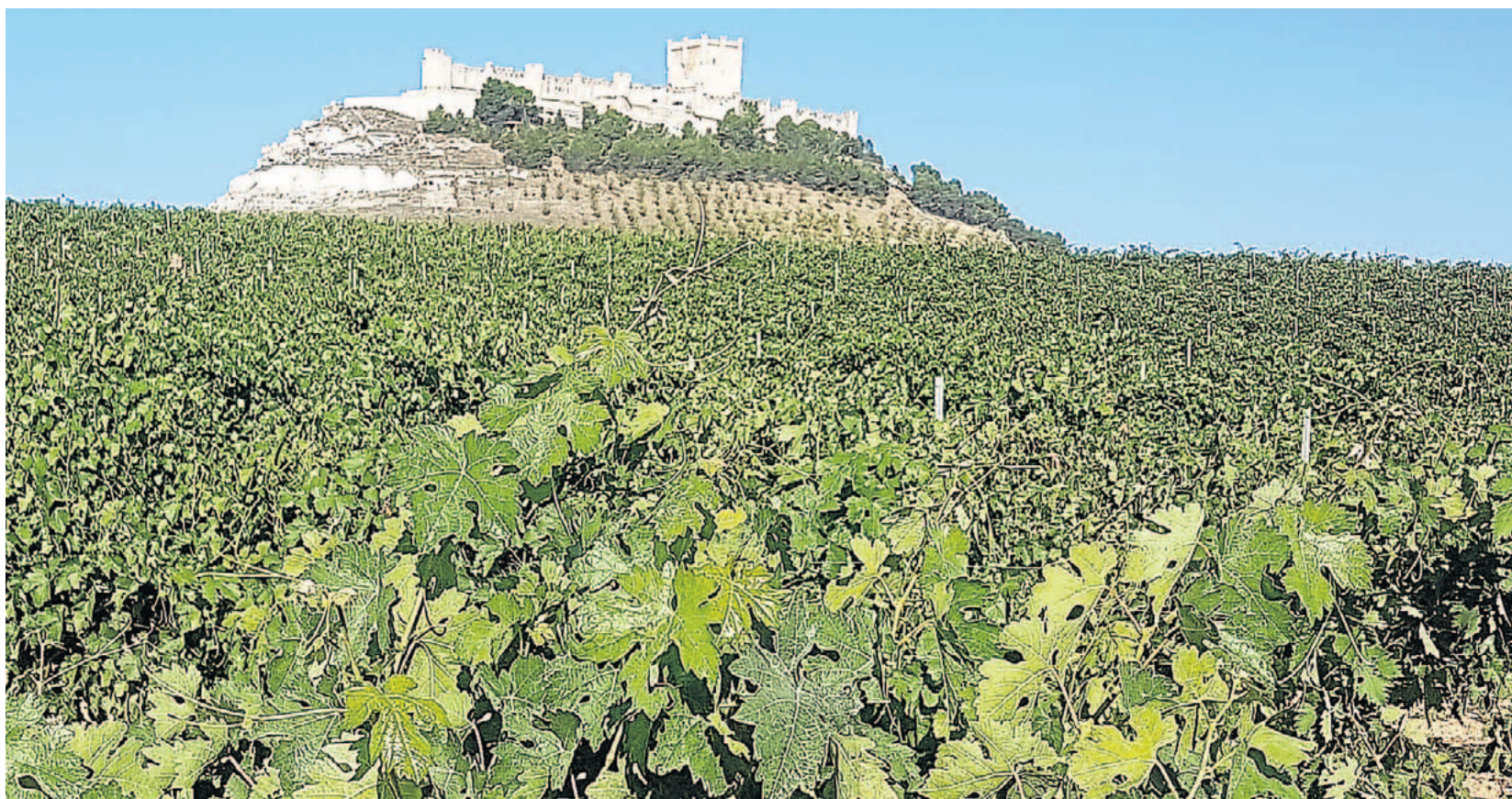
Viñedos en el término municipal de Peñafiel, en plena Ribera del Duero vallisoletana.

También los viñedos de la DO Tierra del Vino de Zamora se vieron afectados por las heladas de abril. Lo que puede suponer