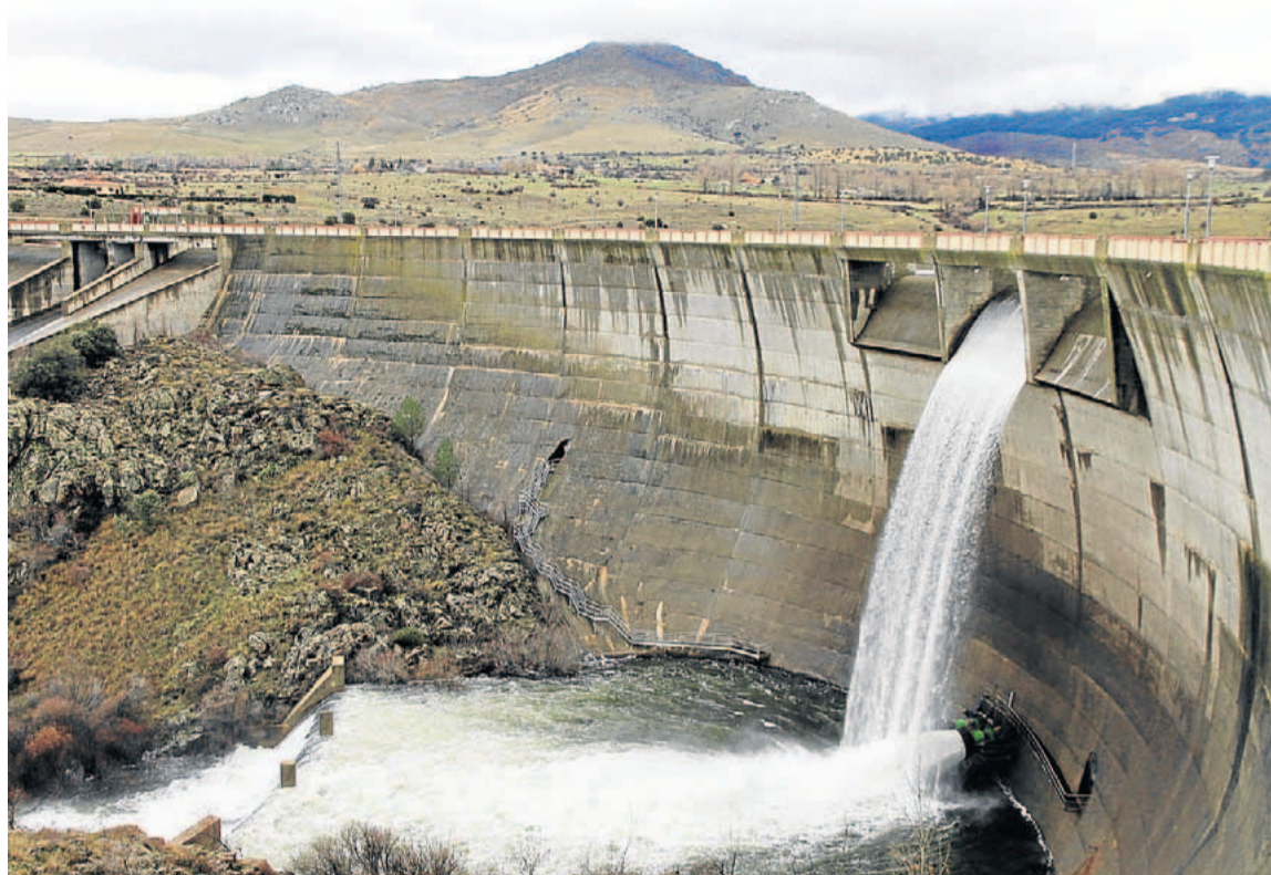
El deshielo llena el embalse del Pontón Alto en Segovia.

En lo que se refiere al regadío, también su comunidad se reunirá hoy con la CHD, pero es plenamente consciente de que la campaña no va a ser normal. «El Carrión tiene cuatro o cinco hectómetros más que el año pasado. Por lo tanto, la situación es similar, aunque dicen que hay un poco más de nieve en la mon-