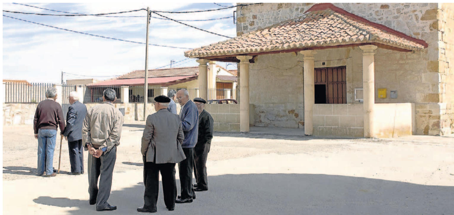
Varios vecinos conversan ante la iglesia de la localidad zamorana de Cazorra.

Los datos del INE entre 2007 y 2017 son contundentes. Donde España gana casi tres habitantes por cada cien que tenía (2,96%), Castilla y León pierde cuatro residentes (el 4,05%), pero en Zamora es peor. De la provincia zamorana han desaparecido diez de cada cien habitantes en ese periodo (el 10,05%) y los que integran el padrón han ganado años. Más de 30 de cada cien zamoranos