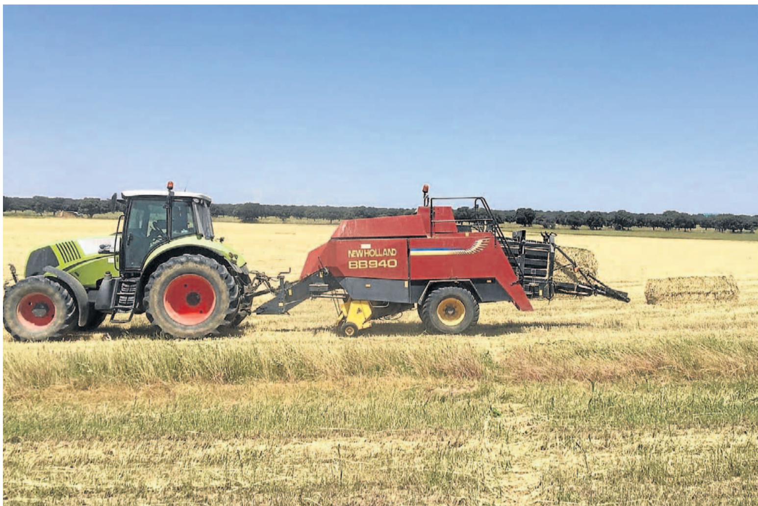
Un tractor empaca el forraje en una explotación de Zamora.