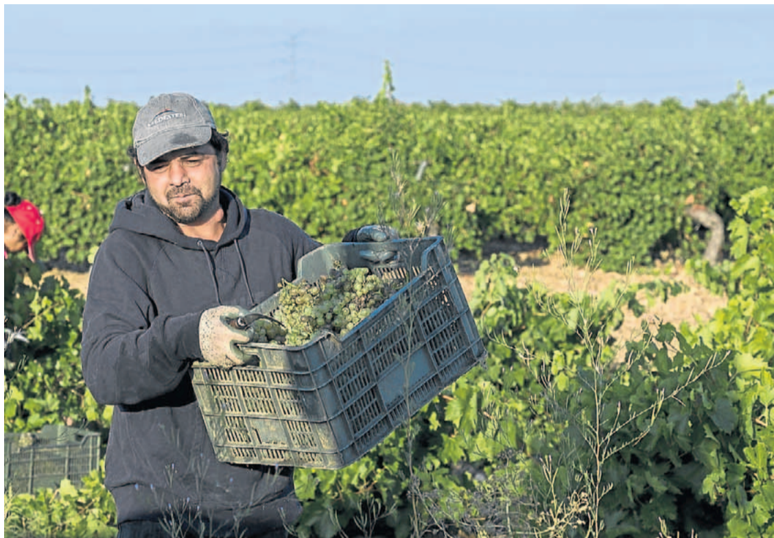
Vendimia manual en La Seca, en plena Denominación de Origen Rueda.

La DO Rueda se lleva la palma con 127.003.306 kilos de uvas, el 99% de variedades blancas, princi-