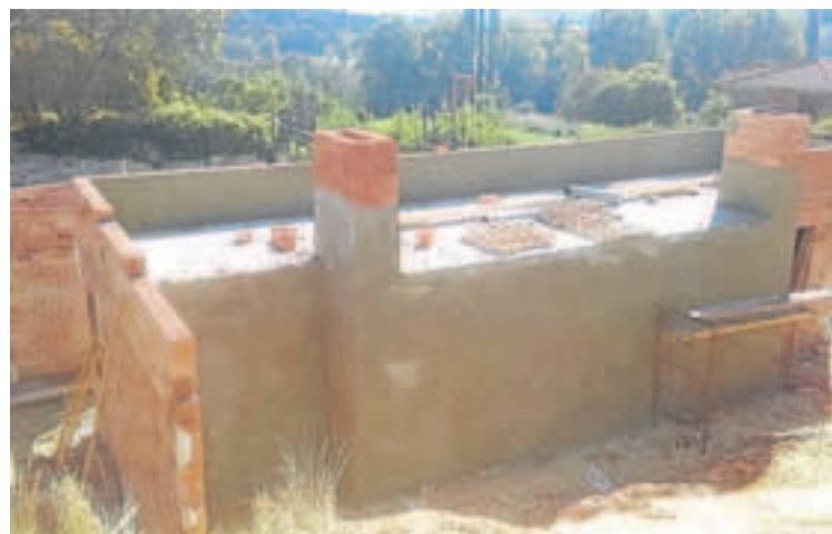
La obra de la quesería, el pasado mes de julio. A la derecha, la construcción en la actualidad.