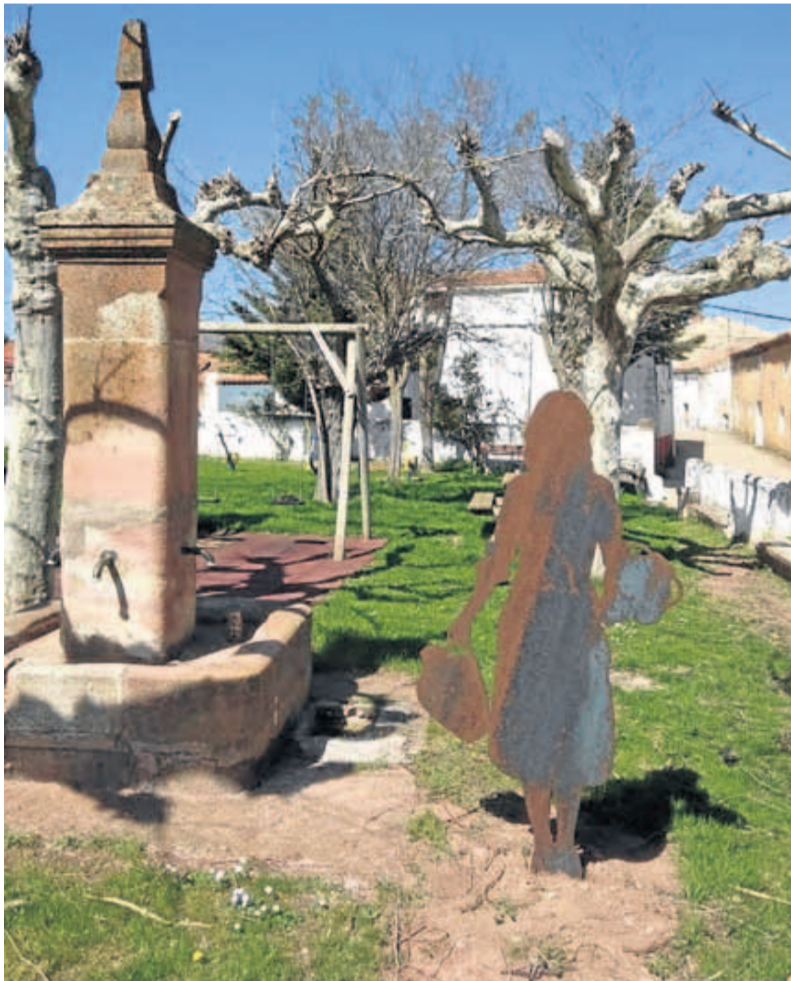
Museo al aire libre en Matalebreras (Soria), un proyecto no productivo liderado por Proynerso.

Esta valoración coincide con la de la Consejería de Agricultura y Ganadería de la Junta, encargada de otorgar las subvenciones pro-