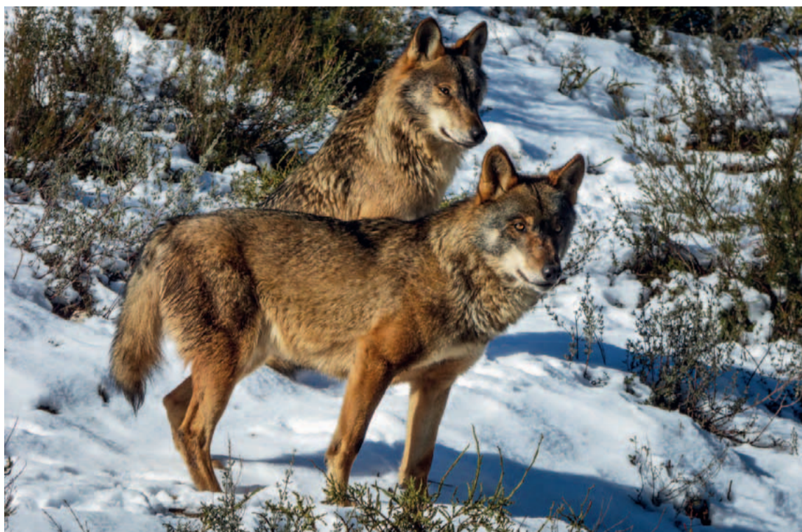
Pareja de lobos fotografiada en una zona de montaña de Castilla y León.

El estudio de Sáenz de Buruaga, como el de Llana y Blanco, establece que el número de ejemplares de cada manada varían en Castilla y León en función de la época del año: más en estío, menos en invierno. Los cachorros explican esta variación, pero también el número de ejemplares expulsados y que, convertidos en lobos solitarios, se convierten en el principal vector de expansión de la especie. Tomando en consideración estas variables y otras