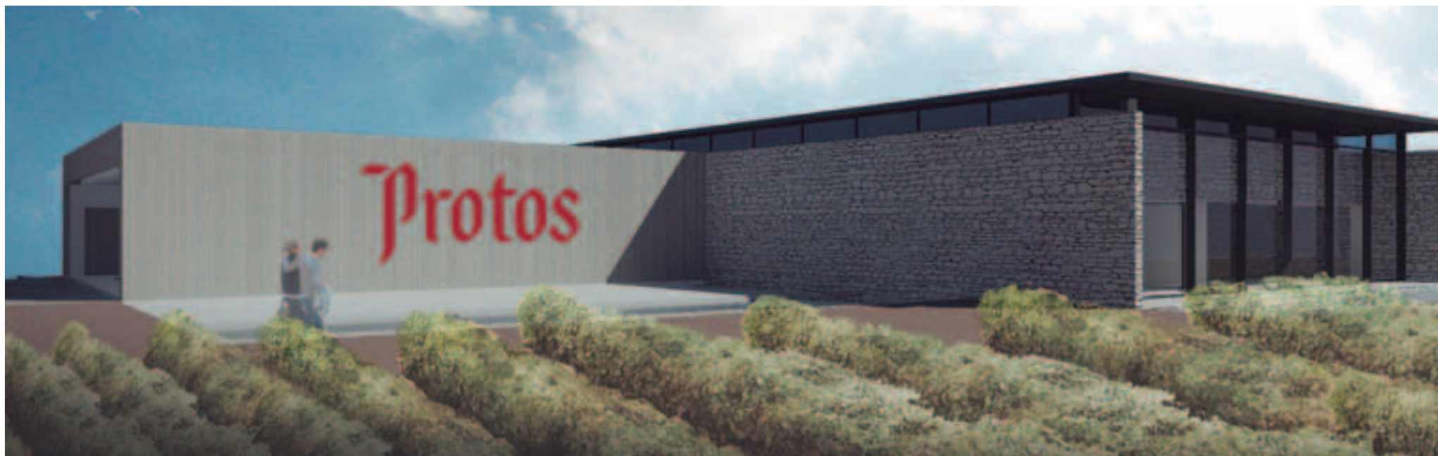
Reproducción infográfica de la futura Bodega Protos, en Cubillas de Santa Marta. Por fuera estará revestida de piedra caliza de la zona y la cubierta será de acero autopatinable.